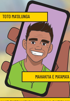
MAHAKI'A E MA'AMĀA